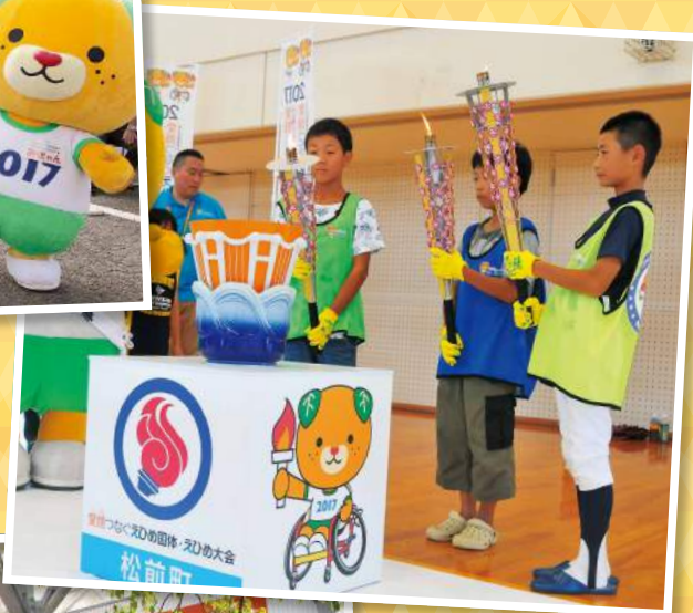
▼炬火に火をつける松前、岡田小学校と、北伊予中学校の代表(7月30日松前町筒井の松前公園体育館で)