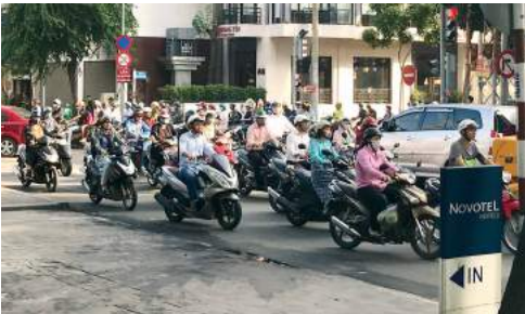
朝のホーチミン市内(宿泊ホテルの前で)

ベトナムは、国民の平均年齢が30歳と若者の多い国で、今後大きな発展が見込まれます。人口は9,170万人(2015年)で、増加傾向にあるとのこと。北のハノイが、政治の中心です。私たちの泊まったホーチミン市(旧サイゴン)は商業の中心地で、市内は大変活気があり、日本製のバイクであふれています。日本の運転感覚ではまず運転できないでしょう。