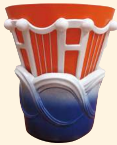
【炬火受皿】 下半分は瀬戸内海の波を表わしており、砥部焼で出来ています。

炬火台の火は、4月から9月にかけて、県下20市町の炬火イベントで採火されたものを、9月30日の総合開会式オープニングプログラムで、集火し「愛顔つなぐえひめの炎」として、式典で炬火台に点火します。