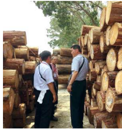
タビコ社の貯木場で、愛媛からのヒノキをみる。左の後ろ姿が私です。

ベトナムは、国民の平均年齢が30歳と若者の多い国で、今後大きな発展が見込まれます。人口は9,170万人(2015年)で、増加傾向にあるとのこと。北のハノイが、政治の中心です。私たちの泊まったホーチミン市(旧サイゴン)は商業の中心地で、市内は大変活気があり、日本製のバイクであふれています。日本の運転感覚ではまず運転できないでしょう。