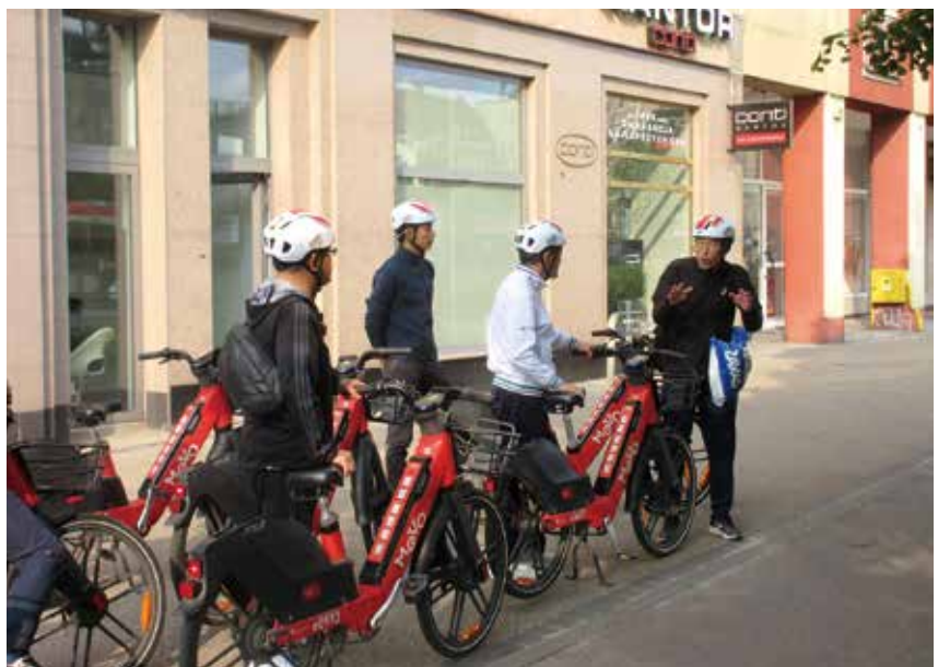
グダンスク市(ポーランド)の自転車道を視察する知事一行

Velo-city 2027については、今年4月から庁内に専任部署を設置し、これまで開催された他国の事例を参考に準備を本格化させているが、国内初開催となる大規模自転車国際会議であることから、先月、中野国土交通大臣に直接、財政面を含め包括的な支援を要望した。様々な事業の誘致はどの自治体でも行うが、まさに地方創生に直接結びつく独自のイベントであることが