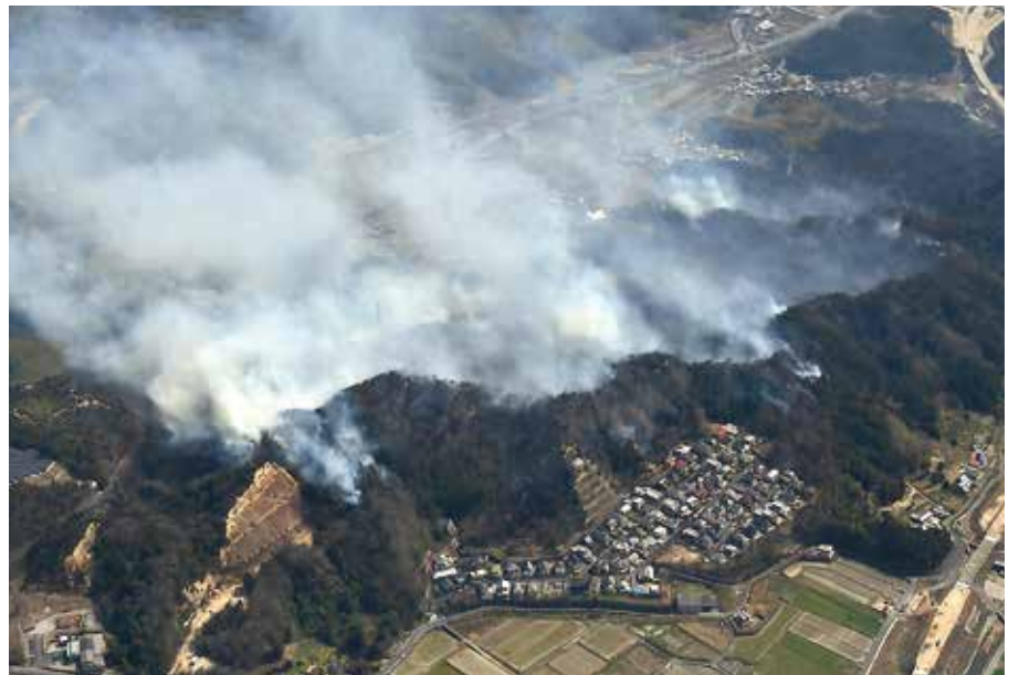
民家にまで迫ってきた山火事(3月25日)

一方で、今回の被災区域は、花崗岩の風化したマサ土で構成されるぜい弱な地質構造に加え、急しゅんな地形であることから、過去にも山地災害が発生しており、森林の焼損によって山林の保水力が弱まり、表面侵食が起りやすくなる懸念が、今後の大雨により土砂災害などの二次被害が生じないかと不安を感じる。これから森林復旧や機能回復が、重要な課題であると改めて認識したが、二次災害の防止や森林の復旧に県としてどう取り組むのか。