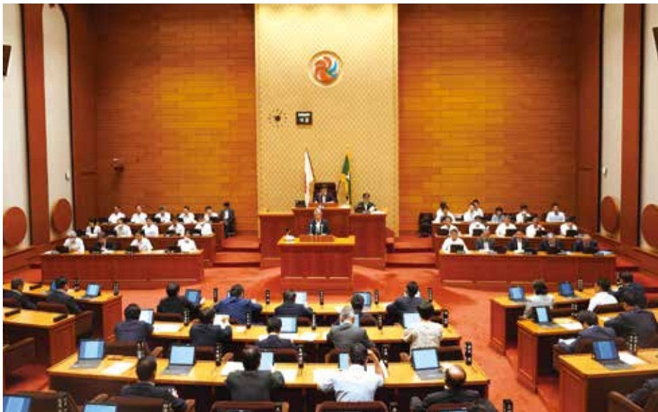
一般質問に登壇した議場風景

今回策定された「地方創生2・0」基本構想には、一番こだわった、ごども子育てや教育費に関する支援について、ナショナルスタンダード(注1)の観点も踏まえて検討すること、企業版ふるさと納税制度の更なる活用促進を図ること、特に、未来の成長の糧となる地方の取組に交付金は活用されるべきであり、それを国が徹底的に支援することなど、私が国の有識者会議で繰り返し申し上げてきた内容が全て国の役割と