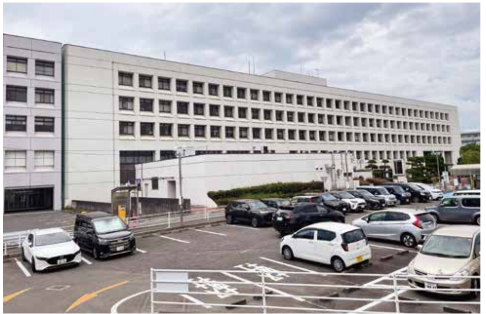
移転・新築が決まった県立今治病院

その後、圏域の人口減少や高齢化、新型コロナウイルス後の患者数や民間病院の病床数の動向など、最新のデータを踏まえて、改めて地元医師会や関係自治体と協議を重ねた。その結果、圏域の医療