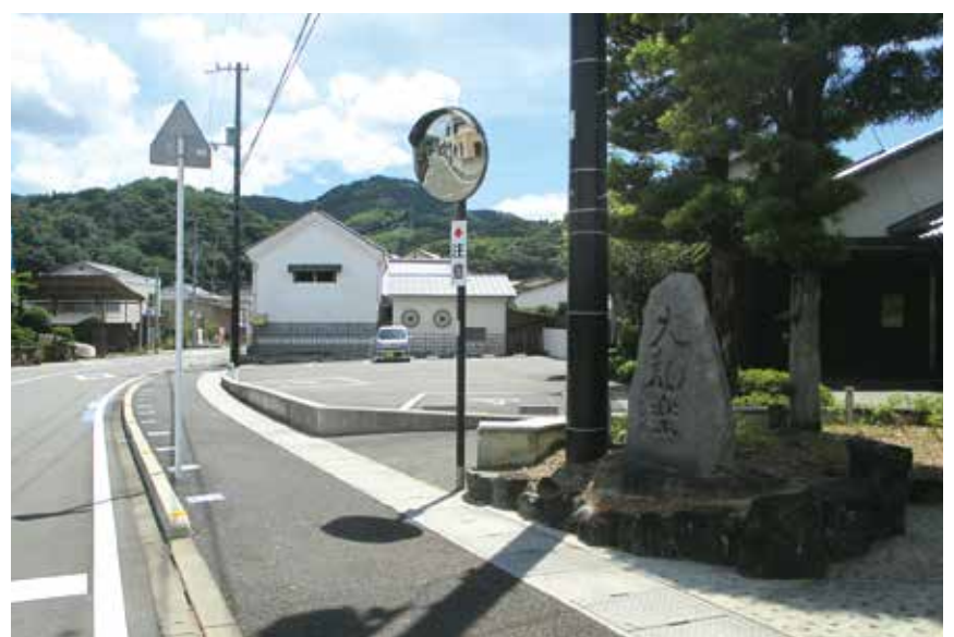
サテライト会場に決まった砥部町の砥部ミュージアム通り。アーティストと地域との交流が期待される。手前右に「坂村真民記念館」、奥に砥部むかしのくらし館。

初開催となる「アートベンチャーエヒメフェス2025」においては、「ここにある豊かさ」をテーマに掲げ、地域の文化や歴史、日常の隠れた魅力に光を当て、砥部町をはじめとした各会場の地