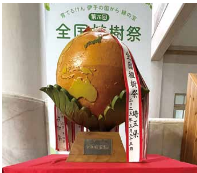
県庁本館に展示された木製地球儀

このため、言葉の文化が豊富な本県独自の取組として、昨年度から「明日の森林へ贈る愛レタープロジェクト」を展開し、これまでに寄せられたメッセージを、大会テーマソングを始め様々な場面で活用するほか、昨年12月には、幼児期からの森林環境教育を推進するためのフォーラムの開催や、大会等で使用する苗木を、県内の延べ8千人の児童生徒に学校で育ててもらおう取組など、開催意義の共有・浸透を図るための県民