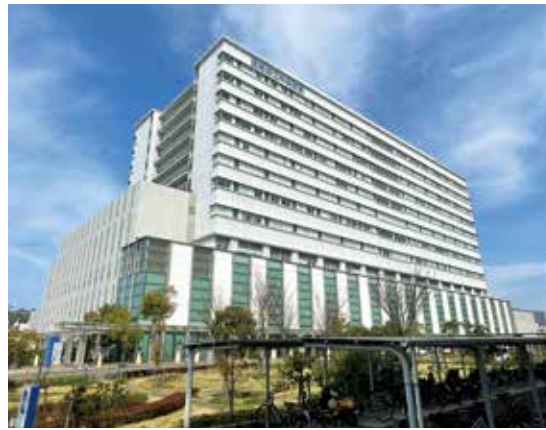
県立中央病院の全景

▼ 県立病院への給与改定差額緊急支援金 (9億2,610万円)と政策的医療維持緊急支援金(10億9,821万円)物価高騰の影響を受ける県立病院の経営支援のため、一般会計繰出金を増額しました。