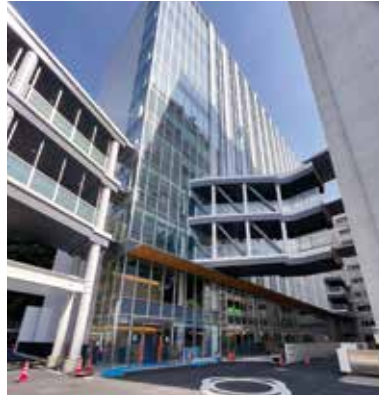
新潟県第二別館。1・2階が官民共創拠点 E:N BASE (エン・ベース)