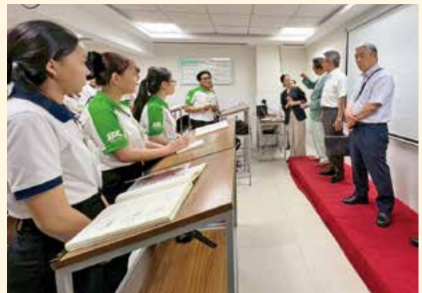
エスハイ社の教室で生徒さんと意見を交わす(写真右側手前)

の再加速、出生数の更なる減少という厳しい現実となっています。新たな対策に早急に取り組むため、将来人口の再推計をしました。今回の推計では、生産年齢人口(15~64歳)の急減も予測されます。この世代は2025年時点で約69万人いますが、団塊ジュニア世代が高齢者となる2040年には50万人を切り、2060年には約29万人にまで減る見通しです。あらゆる業界で人手不足が深刻化するだけでなく、地域の持続可能性にも不安が漂います。「縮小社会」を見据えた体制づくりが必要です。▼2月11日から国際交流促進議員連盟で、ベトナムの本県関係企業を視察しました。特に、最大都市ホーチミンにあるエスハイ社が印象に残りました。同社は、日本向けに高度外国人材や技能実習生らを育成する人材送り出し機関です。愛媛県は2024年に同社と覚書を締結。2022年に経済協力の覚書を結んだベンチエ省(行政区再編で現ビンロン省)を含めた3者が連携し、人材受け入れの愛媛モデル構築を進めています。視察では、日本人チーフコンサルタントの案内で各教室を見て回り、教室生と意見交換。真剣に学ぶ生徒の姿に感銘を受けました。日本は円安で、賃金面では彼らにとって決して魅力ある国ではありません。文化的な違いを乗り越えるための生活環境の整備や待遇の改善を進め、