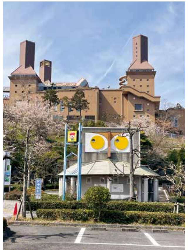
えひめこどもの城入口駐車場付近