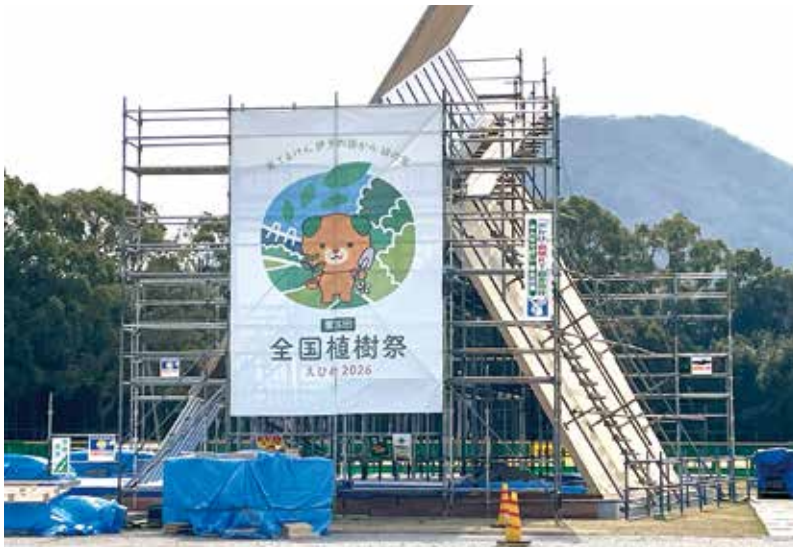
準備が進む全国植樹祭会場(県総合運動公園多目的広場)

①苗木の新植・改植や灌水施設整備 ②ハウス、ネット、モノレール、ドローンなど整備